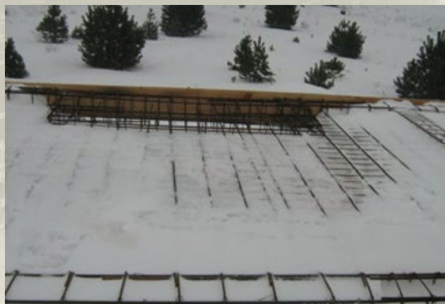
Rys. 2. Błędy zabudowy mieszanki betonowej – oblodzone zbrojenie

Stosowanie kombinacji domieszek (przyspieszających, redukujących ilość wody) pozwala na optymalne dostosowanie właściwości mieszanki betonowej i betonu do warunków otoczenia w trakcie wykonywania prac budowlanych. Bardzo ważne jest odpowiednie przygotowanie procesu betonowania, grunt, podbudowa, deskowanie, podobnie jak zbrojenie, nie mogą być pokryte warstwą śniegu lub lodu (rys. 2). Zamarznięta na powierzchni deskowania lub zbrojenia woda, wpływa na lokalne zmiany współczynnika w/c, a tym samym pogarsza właściwości betonu. Grunt lub deskowanie powinno mieć temperaturę, która nie spowoduje zamarzania młodego betonu przed osiągnięciem przez niego wytrzymałości, zapewniającej odporność na zamarzanie. Podczas układania betonu zaleca się ponadto jego ochronę przed opadami atmosferycznymi.