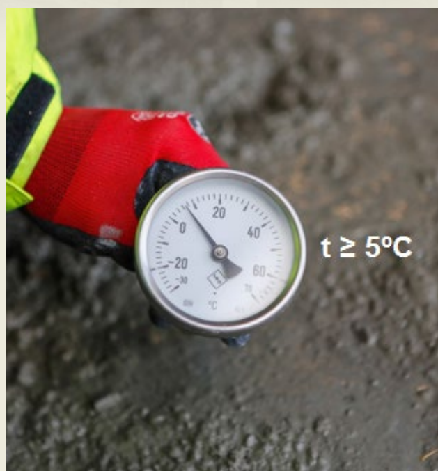
Rys. 1. Minimalna temperatura mieszanki betonowej

Wg normy PN-EN 206:2014 "Beton – Wymagania, właściwości, produkcja i zgodność" temperatura mieszanki betonowej podczas zabudowy nie powinna być niższa niż 5°C (rys. 1). Zachowanie temperatury mieszanki na poziomie powyżej 5°C pozwala uniknąć ryzyka zamarznięcia wody w mieszance. Niemniej ważne jest uzyskanie przez młody beton minimalnej wytrzymałości na ściskanie, zanim ulegnie on pierwszemu zamarznięciu. Naprężenia powstające wskutek zwiększania objętości przez zamarzającą wodę mają charakter naprężeń rozciągających. Gdy ich wartość przekroczy granicę wytrzymałości matrycy cementowej, dochodzi do rozerwania powstałych wiązań.