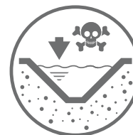
ZBIORNIKI ODPADÓW CIEKŁYCH