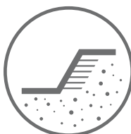
ROBOTY ZIEMNE FUNDAMENTOWANIE KONSTRUKCJE OPOROWE