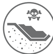
SKŁADOWISKA ODPADÓW STAŁYCH