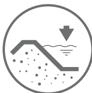
ZBIORNIKI WODNE ZAPORY