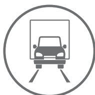
DROGI I POWIERZCHNIE OBCIĄŻONE RUCHEM